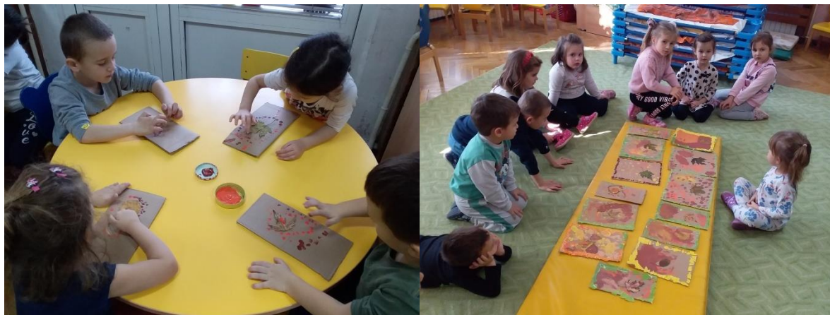
Једна од радионица, ликовна радионица „Јесења чаролија“

У септембру због специфичне ситуације због пандемије COVID-19 и поштовања наложених мера заштите, постигнут је договор да се радионице реализују на нивоу група без мешања деце различитог узраста. Планирано је да почетак радионица буде у новембру и за сада је реализовано 4 радионице свих постојећих тимова.